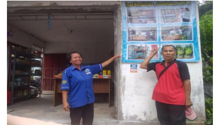
BUMDESA DESA BAGOK