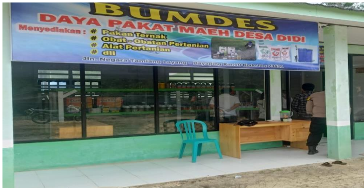
BUMDESA DESA DIDI