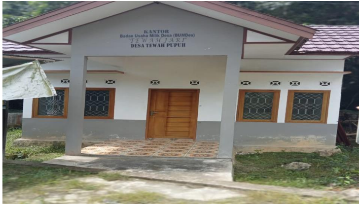
BUMDESA DESA TEWAH PUPUH