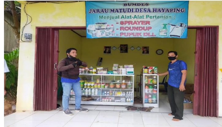
BUMDESA DESA HAYAPING