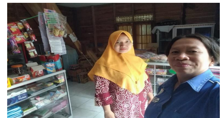
BUMDESA DESA GUDANG SENG