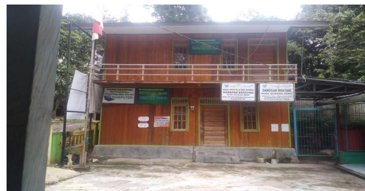
BUMDESA DESA GUDANG SENG